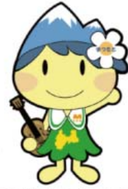
松本市マスコットキャラクター アルプちゃん

石畳で覆われた豊かな森林の中を溪流に沿って歩きます。夏の強い日差しも木々の葉が和らげ、さわやかな散策が楽しめます。